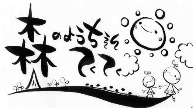
イラスト:法生さん