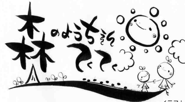
イラスト：法生さん