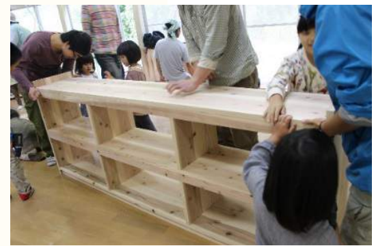
森の木の板を使っての家具づくり、 大人も子どもも真剣です