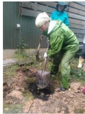
ウメやモモ、ブルーベリーなど 実のなる木を植樹しました