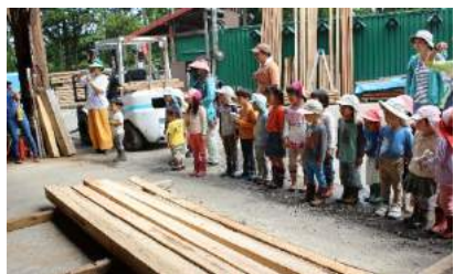
伐った木が 板になるところを 製材所で 見せてもらいました