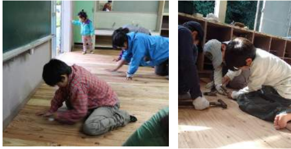
フローリングの貼り替えと 磨き作業をしました