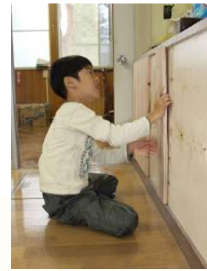
腰板も一枚一枚 貼りました