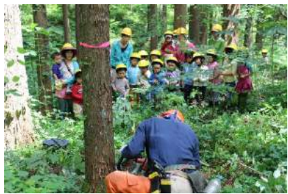
森の木の伐採に 立ち会い、 みんなで木を 引っ張って 道路まで運びました