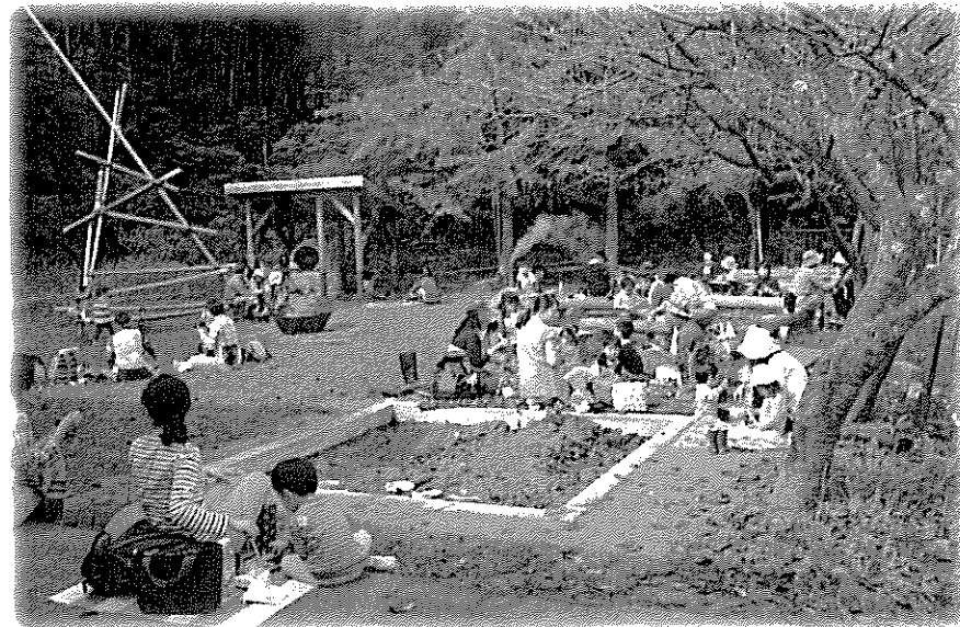
下正善寺のおうちにて